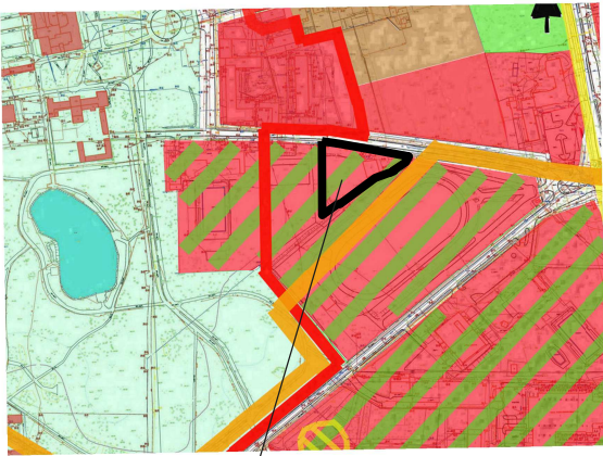
OBSZAR OBJĘTY MIEJSCOWYM PLANEM ZAGOSPODAROWANIA PRZESTRZENNEGO

WYRYS ZE ZMIANY STUDIUM UWARUNKOWAŃ I KIERUNKÓW ZAGOSPODAROWANIA PRZESTRZENNEGO PRZYJĘTEGO UCHWAŁĄ NR XXIV/350/08 RADY MIEJSKIEJ INOWROCŁAWIA Z DNIA 29 PAŹDZIERNIKA 2008 r.