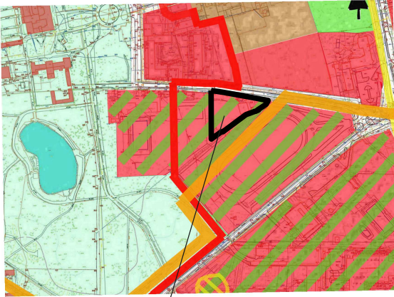
OBSZAR OBJĘTY MIEJSCOWYM PLANEM ZAGOSPODAROWANIA PRZESTRZENNEGO

WYRYS ZE ZMIANY STUDIUM UWARUNKOWAŃ I KIERUNKÓW ZAGOSPODAROWANIA PRZESTRZENNEGO PRZYJĘTEGO UCHWAŁĄ NR XXIV/350/08 RADY MIEJSKIEJ INOWROCŁAWIA Z DNIA 29 PAŹDZIERNIKA 2008 r.