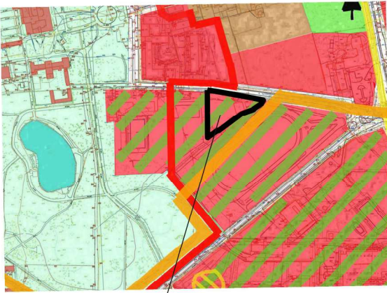
OBSZAR OBJĘTY MIEJSCOWYM PLANEM ZAGOSPODAROWANIA PRZESTRZENNEGO

WYRYS ZE ZMIANY STUDIUM UWARUNKOWAŃ I KIERUNKÓW ZAGOSPODAROWANIA PRZESTRZENNEGO PRZYJĘTEGO UCHWAŁĄ NR XXIV/350/08 RADY MIEJSKIEJ INOWROCŁAWIA Z DNIA 29 PAŹDZIERNIKA 2008 r.