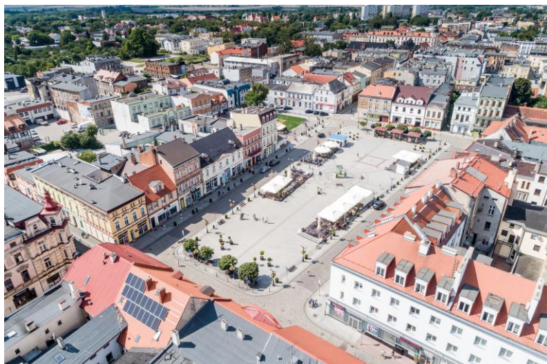
widok w kierunku północno-zachodnim, na pierwszym planie widoczny Rynek, źródło: Urząd Miasta Inowrocławia

7. Fotografia z opisem wskazującym orientację w stosunku do sąsiednich terenów lub stron świata albo mapa z zaznaczonym stanowiskiem archeologicznym