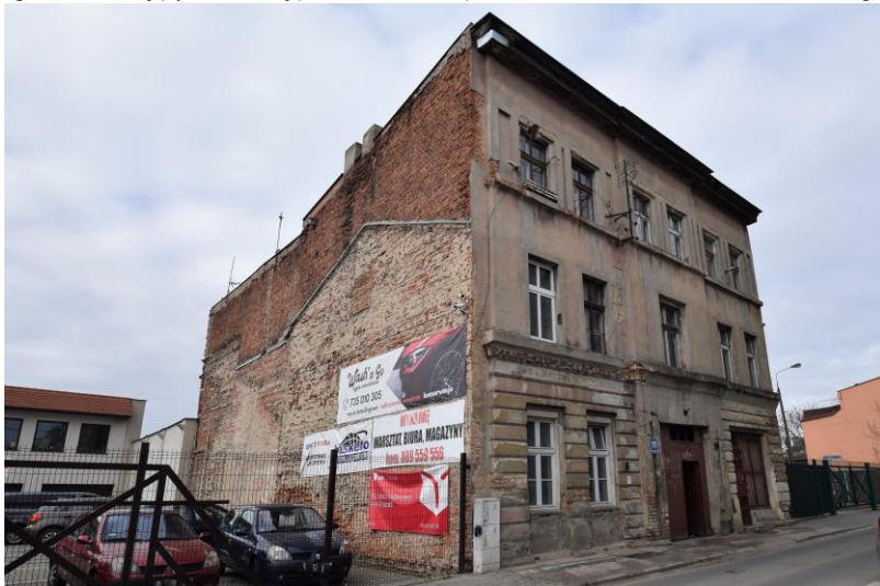
widok w kierunku północno-zachodnim

7. Fotografia z opisem wskazującym orientację w stosunku do sąsiednich terenów lub stron świata albo mapa z zaznaczonym stanowiskiem archeologicznym