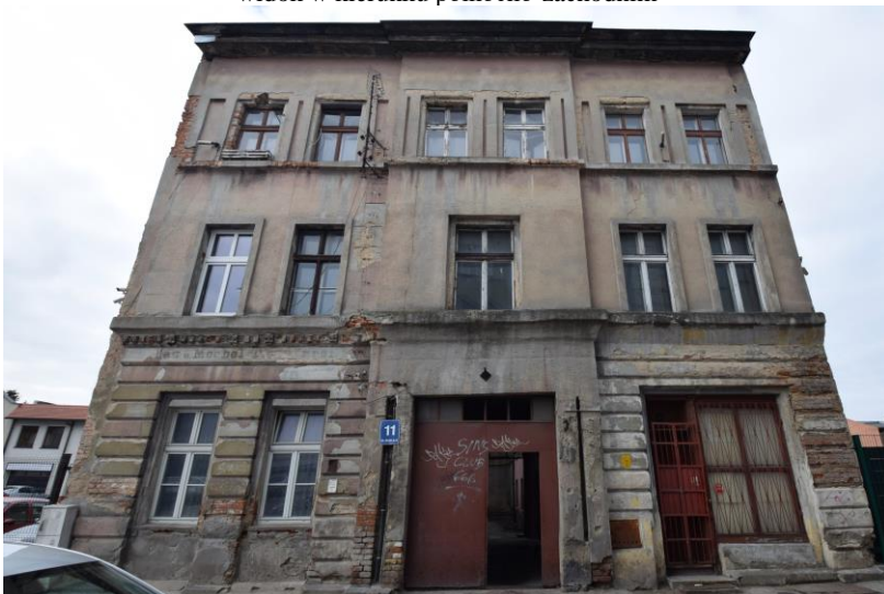
widok w kierunku zachodnim