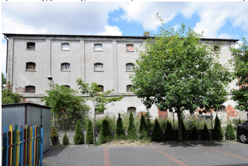
Widok w kierunku północnym

7. Fotografia z opisem wskazującym orientację w stosunku do sąsiednich terenów lub stron świata albo mapa z zaznaczonym stanowiskiem archeologicznym