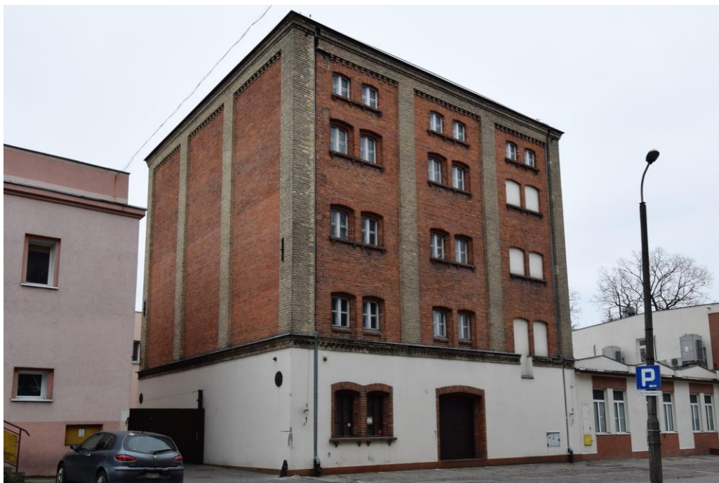
Widok w kierunku południowo-zachodnim

7. Fotografia z opisem wskazującym orientację w stosunku do sąsiednich terenów lub stron świata albo mapa z zaznaczonym stanowiskiem archeologicznym