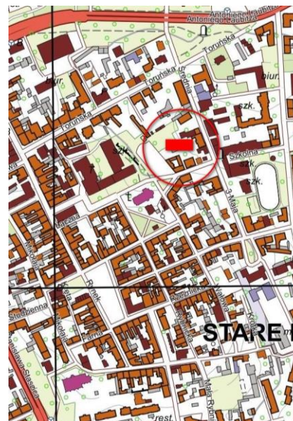
Inowrocław - fragment mapy w układzie 1992, skala 1:10 000, zaznaczona lokalizacja obiektu