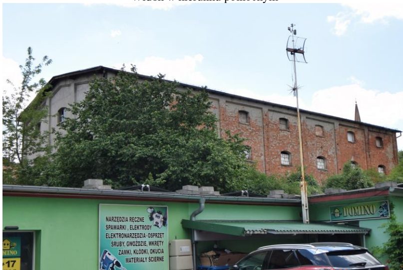
Widok w kierunku południowo-zachodnim