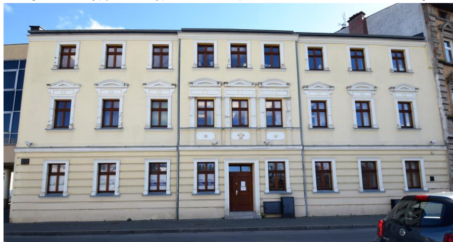
widok w kierunku wschodnim

7. Fotografia z opisem wskazującym orientację w stosunku do sąsiednich terenów lub stron świata albo mapa z zaznaczonym stanowiskiem archeologicznym