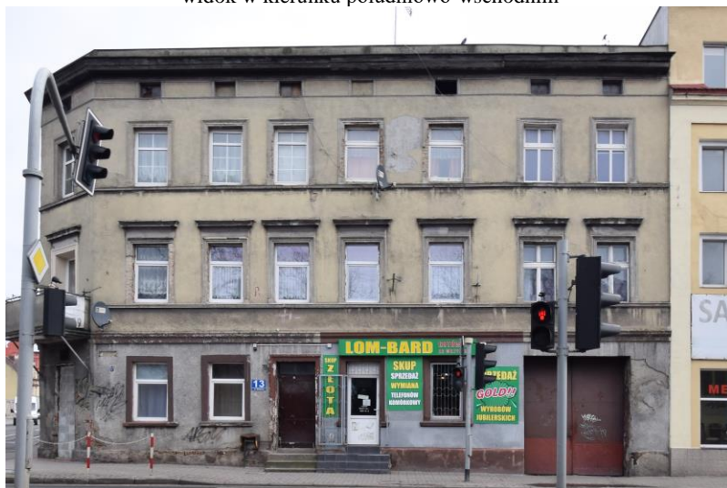
widok w kierunku wschodnim