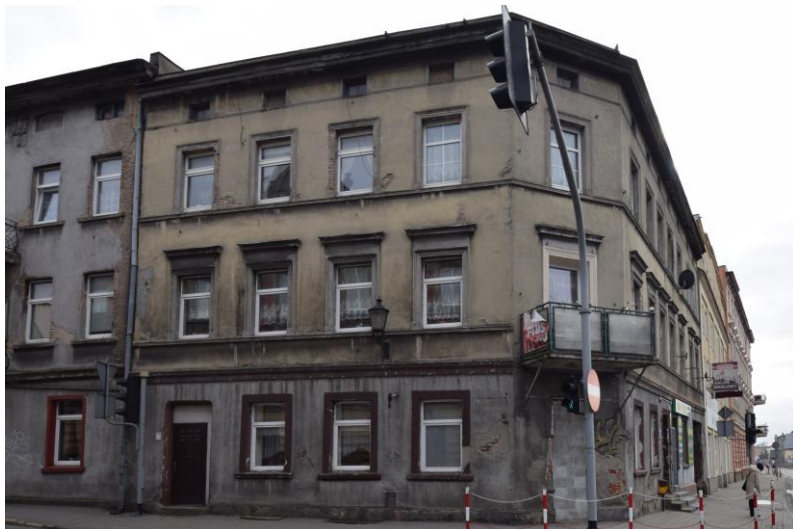
widok w kierunku południowo-wschodnim

7. Fotografia z opisem wskazującym orientację w stosunku do sąsiednich terenów lub stron świata albo mapa z zaznaczonym stanowiskiem archeologicznym