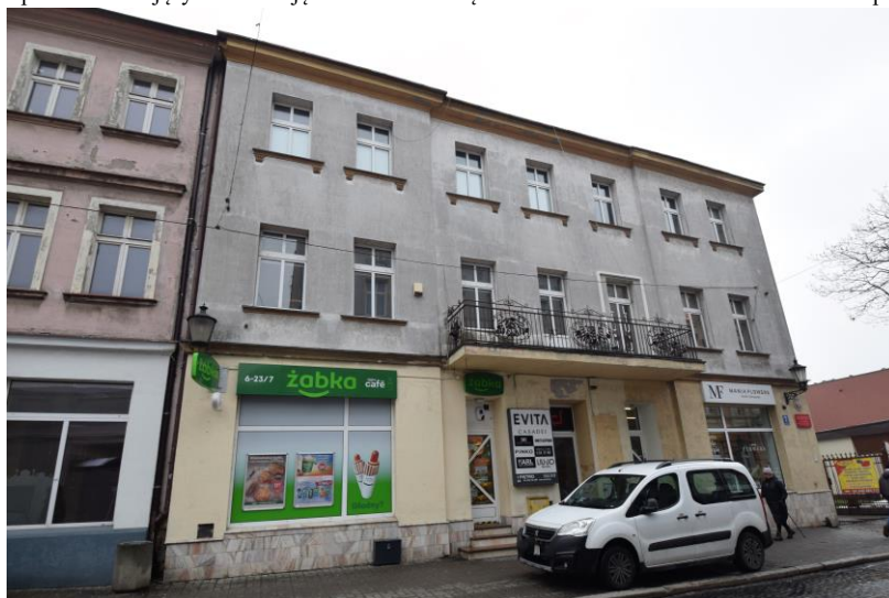
widok w kierunku południowym

7. Fotografia z opisem wskazującym orientację w stosunku do sąsiednich terenów lub stron świata albo mapa z zaznaczonym stanowiskiem archeologicznym