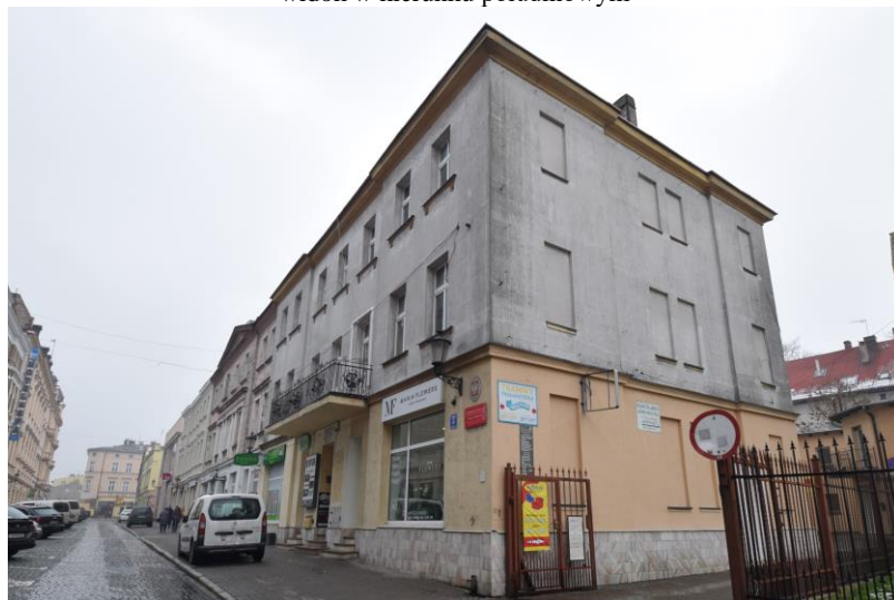
widok w kierunku wschodnim