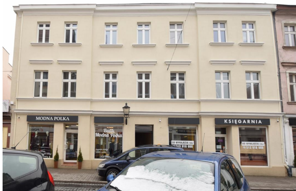
widok w kierunku południowym

7. Fotografia z opisem wskazującym orientację w stosunku do sąsiednich terenów lub stron świata albo mapa z zaznaczonym stanowiskiem archeologicznym