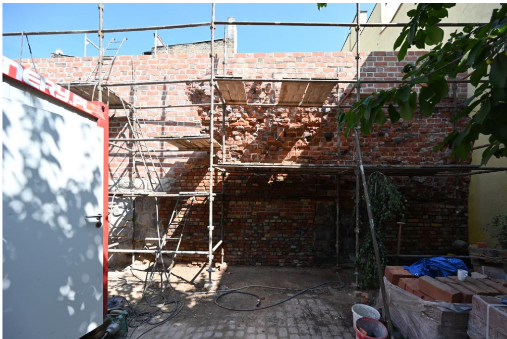
widok w kierunku północnym

7. Fotografia z opisem wskazującym orientację w stosunku do sąsiednich terenów lub stron świata albo mapa z zaznaczonym stanowiskiem archeologicznym