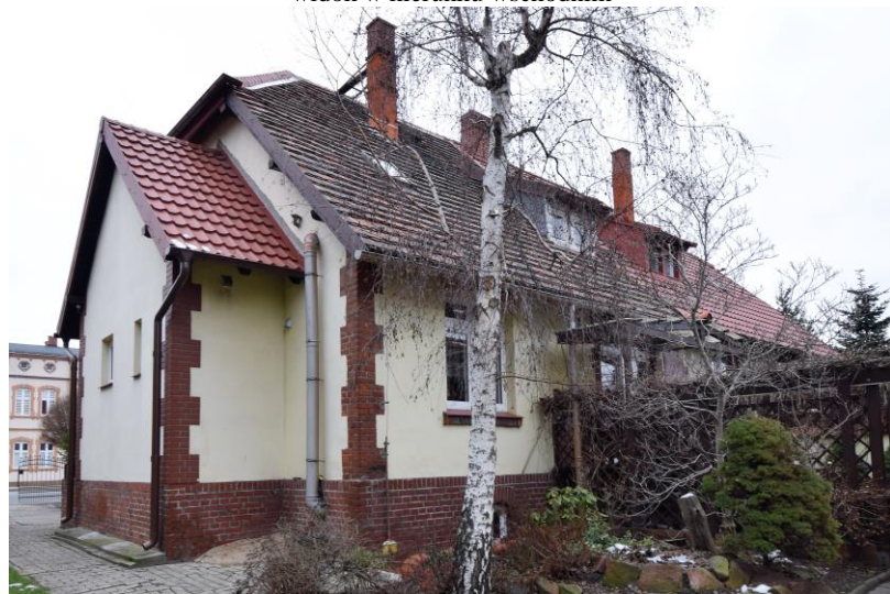
widok w kierunku północno-zachodnim