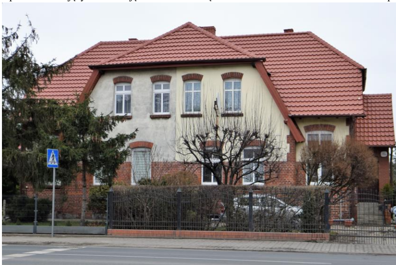
widok w kierunku wschodnim

7. Fotografia z opisem wskazującym orientację w stosunku do sąsiednich terenów lub stron świata albo mapa z zaznaczonym stanowiskiem archeologicznym