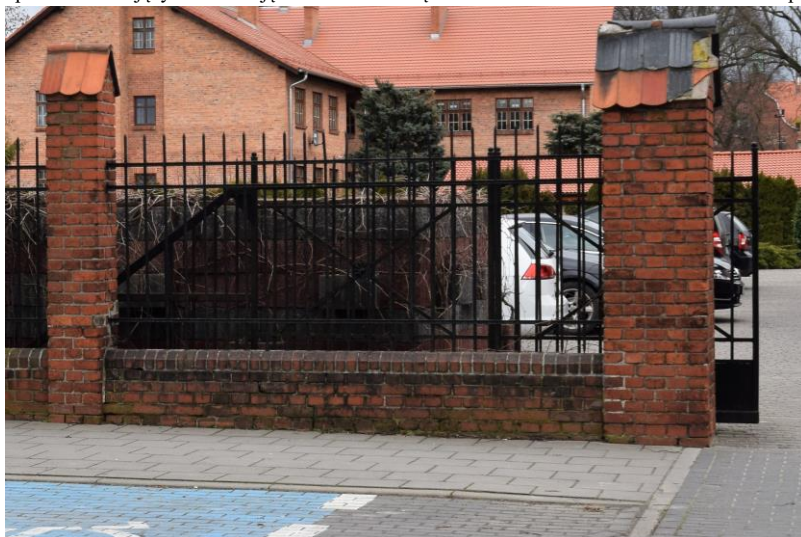
widok w kierunku wschodnim

7. Fotografia z opisem wskazującym orientację w stosunku do sąsiednich terenów lub stron świata albo mapa z zaznaczonym stanowiskiem archeologicznym