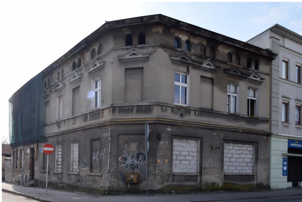
widok w kierunku południowo-zachodnim

7. Fotografia z opisem wskazującym orientację w stosunku do sąsiednich terenów lub stron świata albo mapa z zaznaczonym stanowiskiem archeologicznym