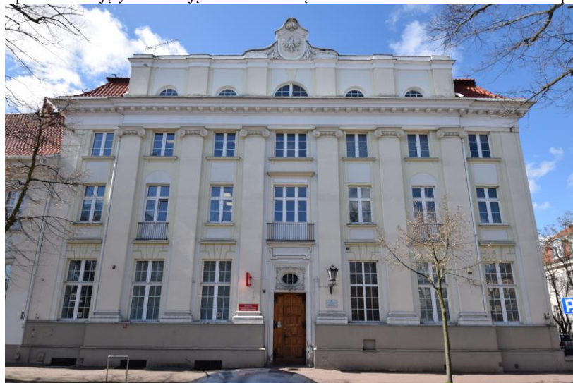
widok w kierunku zachodnim

7. Fotografia z opisem wskazującym orientację w stosunku do sąsiednich terenów lub stron świata albo mapa z zaznaczonym stanowiskiem archeologicznym