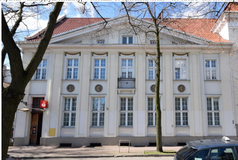
widok w kierunku zachodnim

7. Fotografia z opisem wskazującym orientację w stosunku do sąsiednich terenów lub stron świata albo mapa z zaznaczonym stanowiskiem archeologicznym