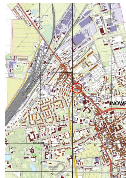
Inowrocław - fragment mapy w układzie 1992, skala 1:10 000, zaznaczona lokalizacja obiektu