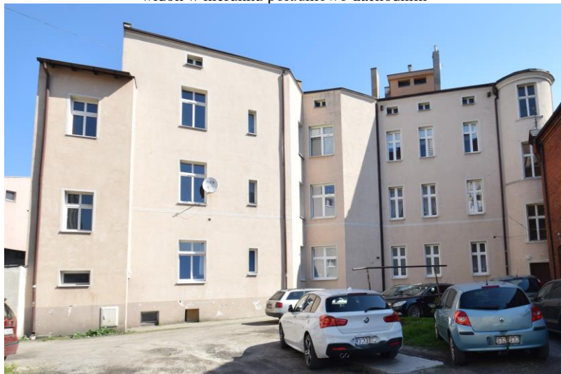
widok w kierunku zachodnim