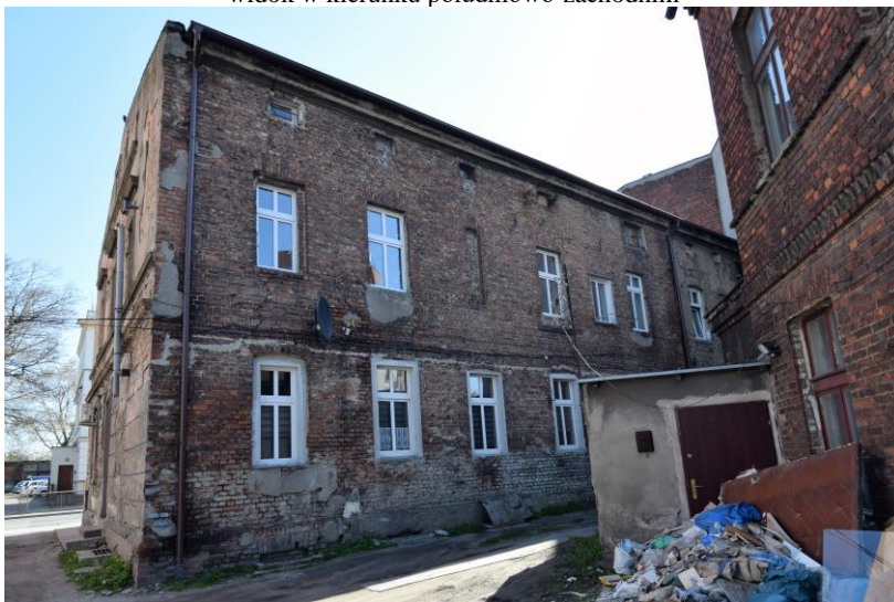
widok w kierunku zachodnim