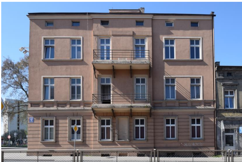
widok w kierunku południowo-zachodnim

7. Fotografia z opisem wskazującym orientację w stosunku do sąsiednich terenów lub stron świata albo mapa z zaznaczonym stanowiskiem archeologicznym