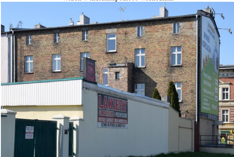
widok w kierunku południowo-zachodnim