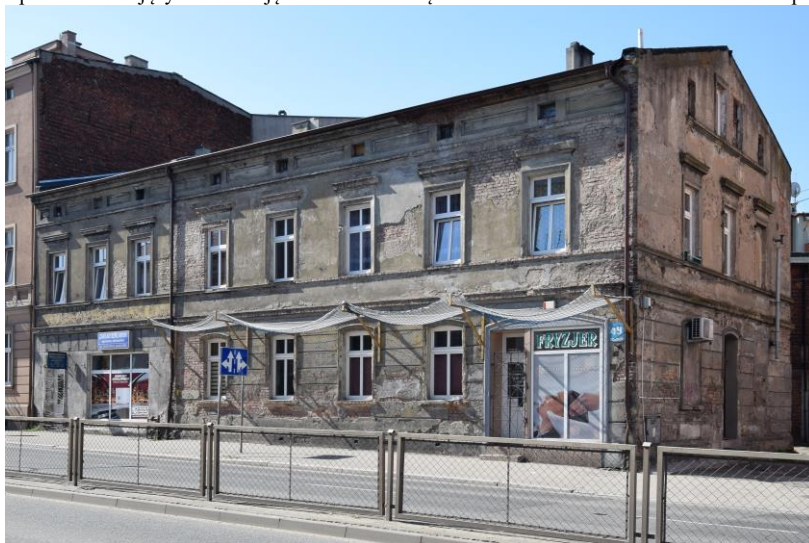
widok w kierunku południowo-zachodnim

7. Fotografia z opisem wskazującym orientację w stosunku do sąsiednich terenów lub stron świata albo mapa z zaznaczonym stanowiskiem archeologicznym