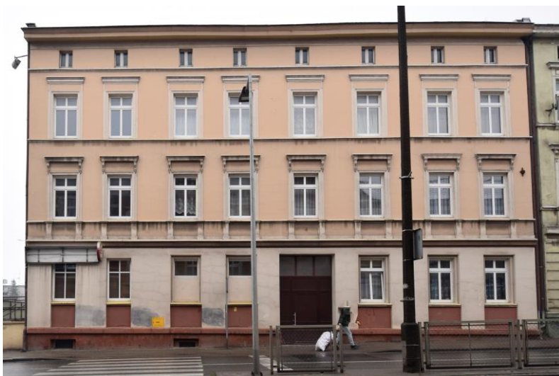
widok w kierunku północno-wschodnim

7. Fotografia z opisem wskazującym orientację w stosunku do sąsiednich terenów lub stron świata albo mapa z zaznaczonym stanowiskiem archeologicznym