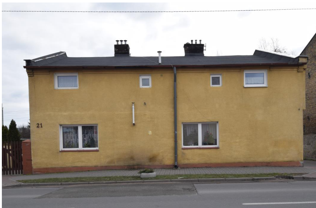
widok w kierunku wschodnim

Obiekt ujęty w wojewódzkiej ewidencji zabytków .