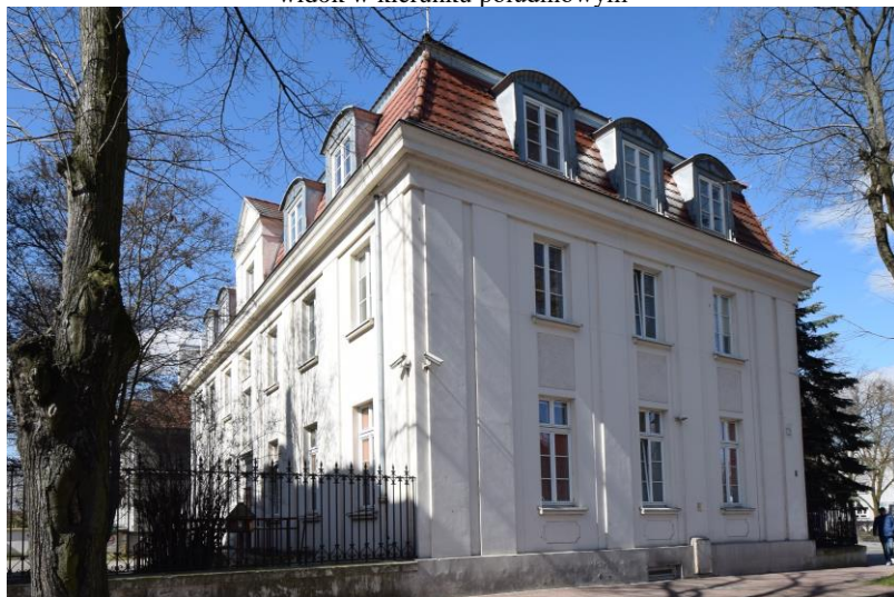
widok w kierunku północno-zachodnim