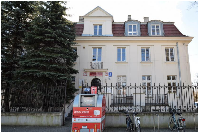
widok w kierunku południowym

7. Fotografia z opisem wskazującym orientację w stosunku do sąsiednich terenów lub stron świata albo mapa z zaznaczonym stanowiskiem archeologicznym