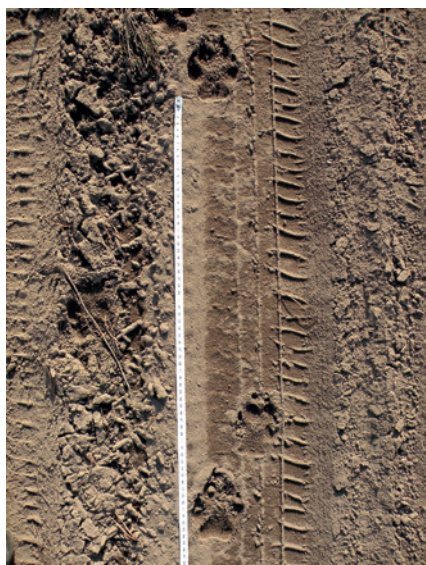
Fot. 5. Pomiar odległości pomiędzy tropami wilka