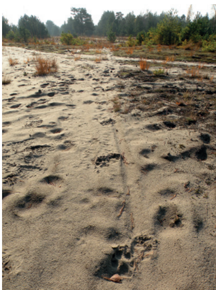
Fot. 6. Ciąg tropów wilka na drodze leśnej. Dokumentacja fotograficzna powinna obejmować także ujęcia tropów wraz z otoczeniem

a w konsekwencji do nieuznania szkody jako spowodowanej przez wilki. Zwierzęta ranne należy jak najszybciej zaopatrzyć weterynaryjnie.