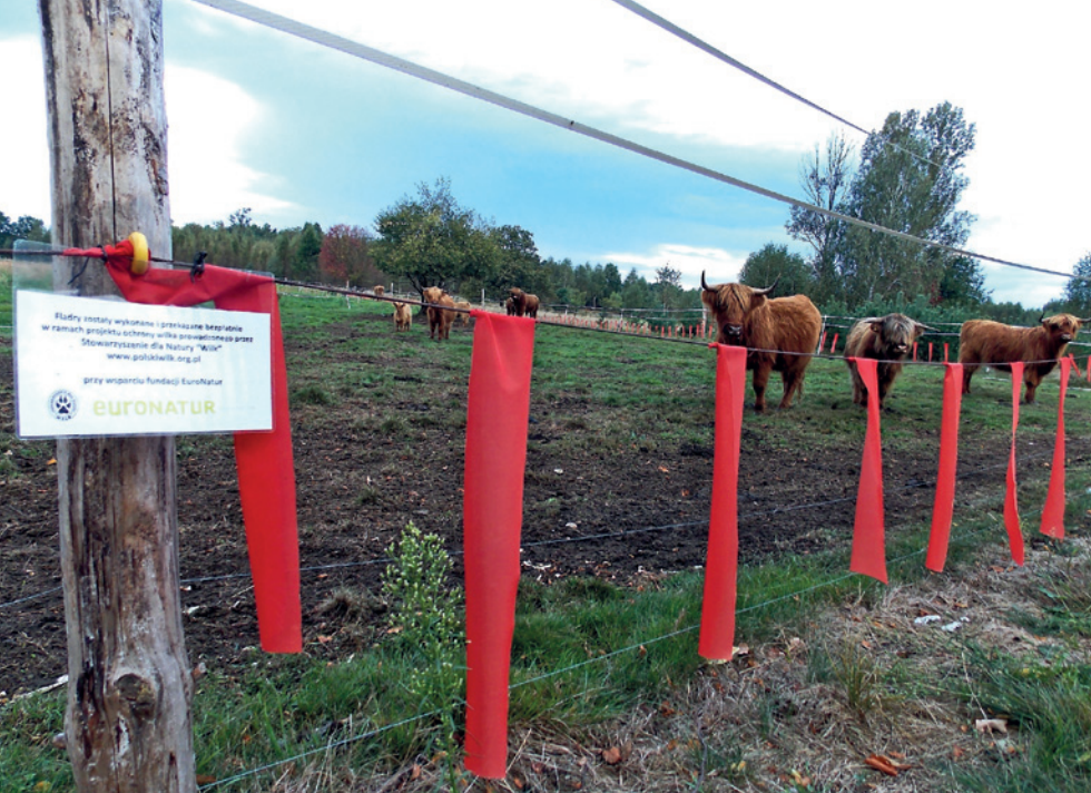
Fot. 15. Kombinacja pastucha elektrycznego i fladr chroniąca bydło w Borach Dolnośląskich

wysokości 70–75 cm nad ziemią. Pastuch składa się z trzech linek (ewentualnie taśm), najniższa linka wisi 15 cm nad gruntem (tam gdzie kończą się wstążki fladr), druga linka na tej samej wysokości co sznurek, do którego przyszyte są fladry, natomiast trzecia linka na wysokości 100 cm nad gruntem. Wyniki testów wskazują, iż jest to metoda 2–10 razy bardziej skuteczna niż fladry lub pastuch stosowane oddzielnie. Kombinację pastucha elektrycznego i fladr stosuje się też w zachodniej Polsce, do ochrony bydła i owiec (Fot. 15).