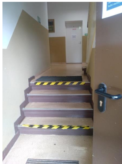
Wejście z lewej strony od parkingu