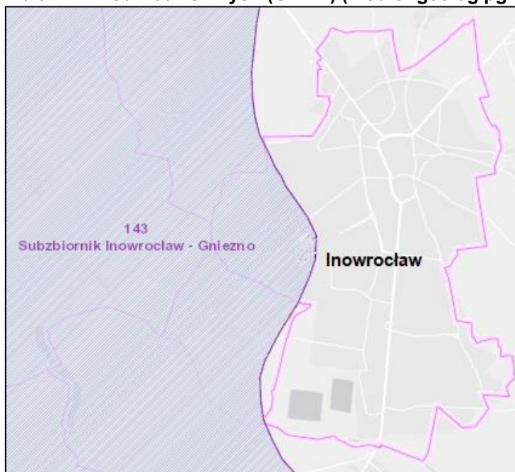
Rysunek 4 Główne Zbiorniki Wód Podziemnych (GZWP)

Od 2016 roku obowiązuje nowy podział obszaru Polski na 172 jednolite części wód podziemnych (JCWPd). Zgodnie z tym podziałem na terenie miasta wydzielono Jednolitą Część Wód Podziemnych (JCWPd) o numerze 43 (europejski kod PLGW600043), jej stan przedstawiono w poniższej tabeli.