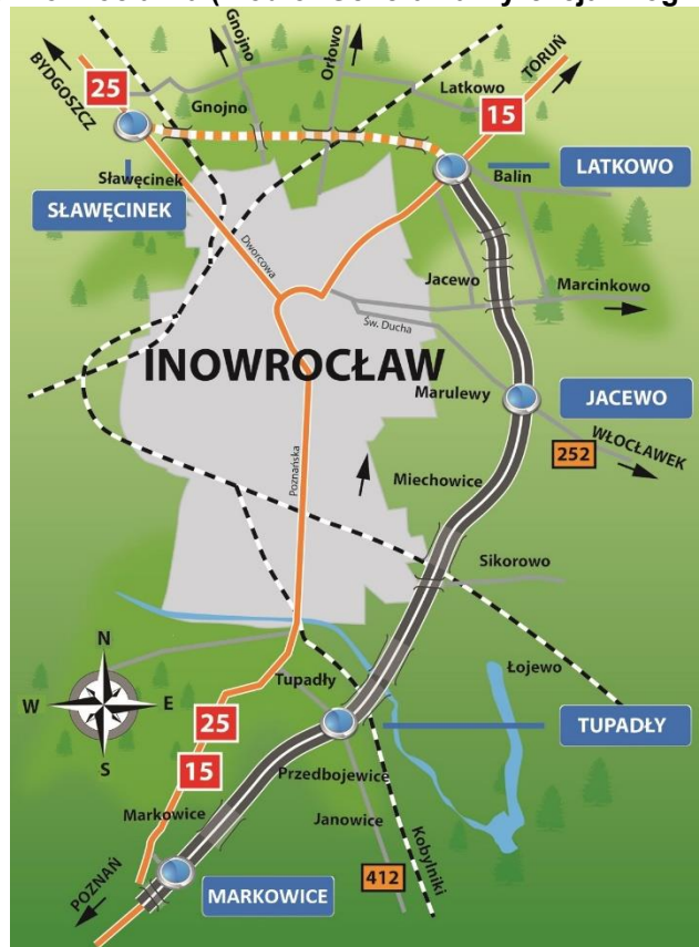
Rysunek 3 Obwodnica Inowrocławia

się w listopadzie 2014 roku, wybudowano prawie 19 km trasy posiadającej po dwa pasy ruchu w obu kierunkach. Powstały trzy węzły drogowe (Latkowo, Jacewo i Tupadły), kilkanaście obiektów inżynierskich, a także przebudowano istniejącą sieć dróg lokalnych. W ramach II etapu inwestycji powstała prawie 5-kilometrowa trasa, która omija miasto od północy i łączy się z istniejącym odcinkiem obwodnicy o długości 19 km. W ramach inwestycji powstały: węzeł drogowy „Sławęcinek”, 5 obiektów inżynierskich, zrealizowano przebudowę istniejącej sieci drogowej oraz budowę chodników i zatok autobusowych. Wykonane zostały również urządzenia ochrony środowiska.