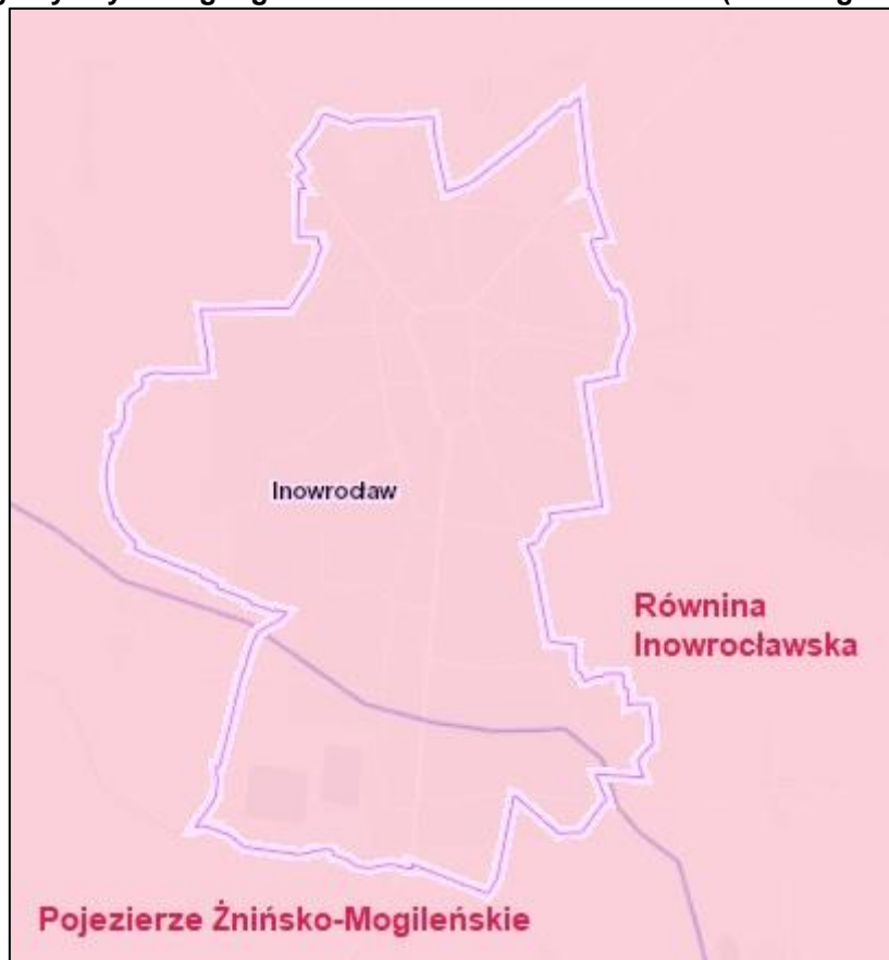
Rysunek 2 Regiony fizyczno-geograficzne na terenie Inowrocławia

Pod względem struktury użytkowania gruntów w mieście przeważają grunty zabudowane i zurbanizowane, które stanowią 53,2% powierzchni miasta. Użytki rolne zajmują 44,7% powierzchni miasta. Szczegółowa charakterystyka zawarta jest w poniższej tabeli.