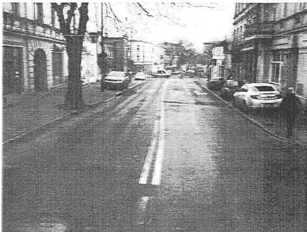
Fot. 3: Pikietaż 0+276. Widoczne drzewo ograniczające skrajnię jezdni.