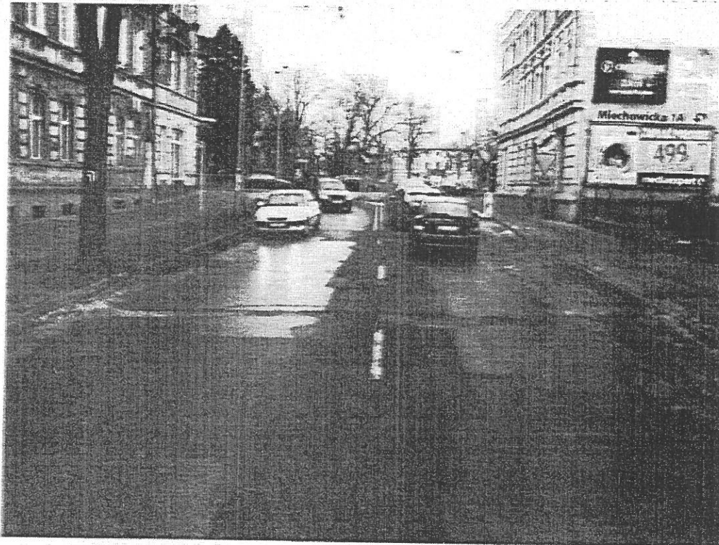
Fot. 2 Pikietaż 0+348. Widoczne drzewo ograniczające skrajnię jezdni.