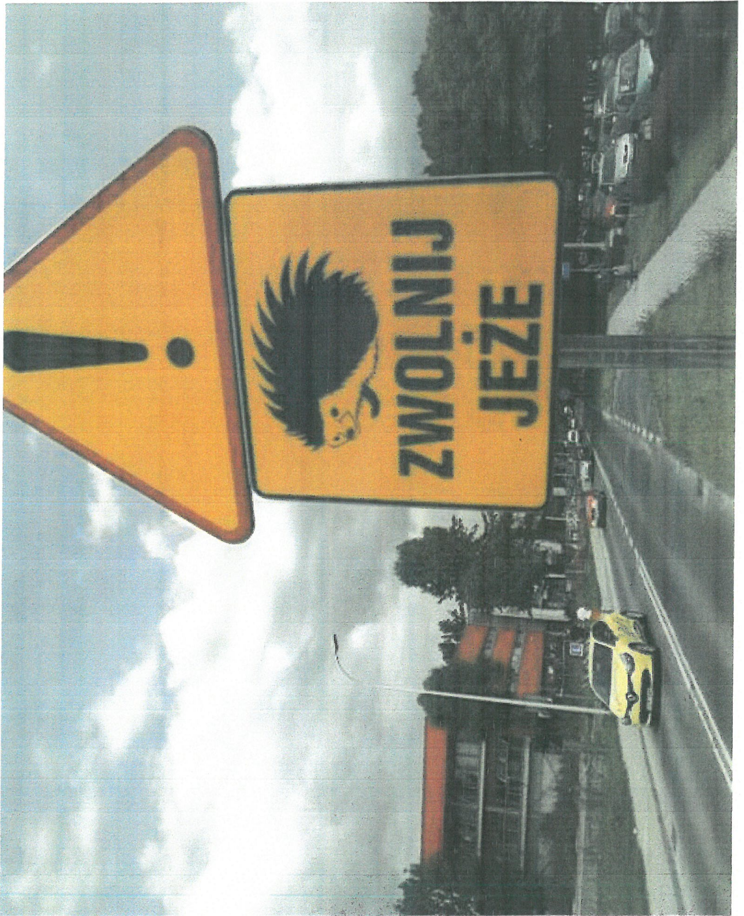
ul. Wpolska w. 11. 11. 2011