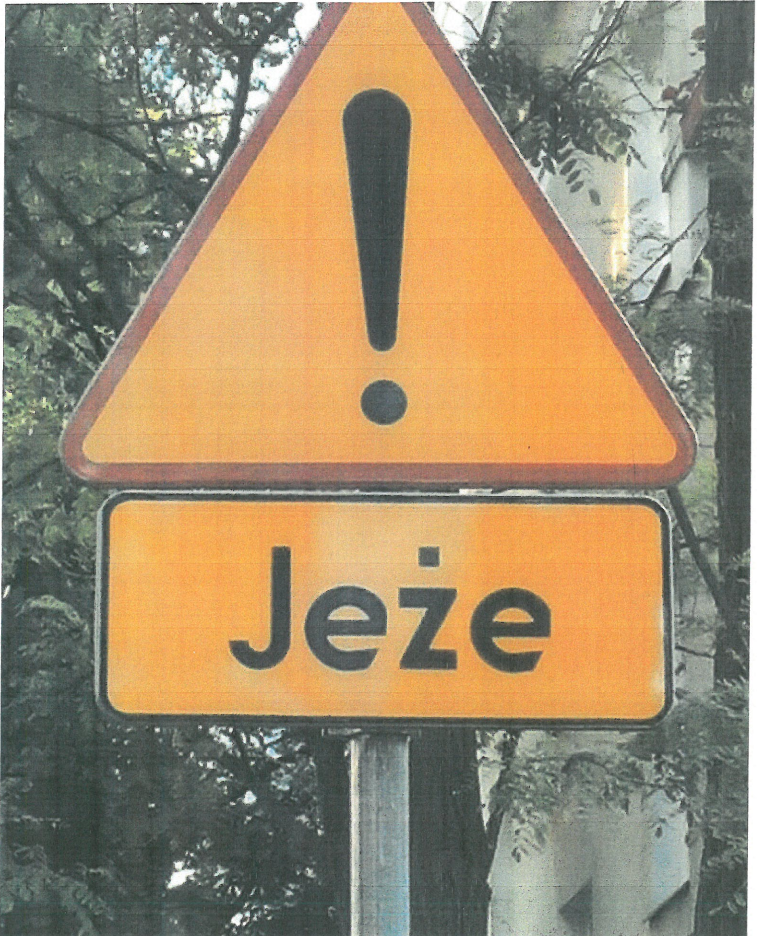
Zdjęcie 2. Wąskozna ul. Filtrowa - Ochota.