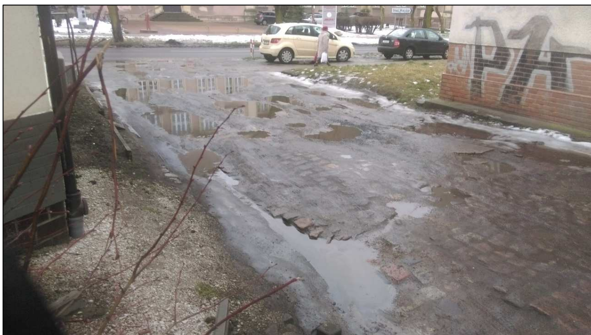
Fot. 3. Zjazd z ul. Narutowicza

Wzdłuż budynku mieszkalnego, parkowane są samochody osobowe (fot. 1). Pozostały obszar nie jest wykorzystywany.