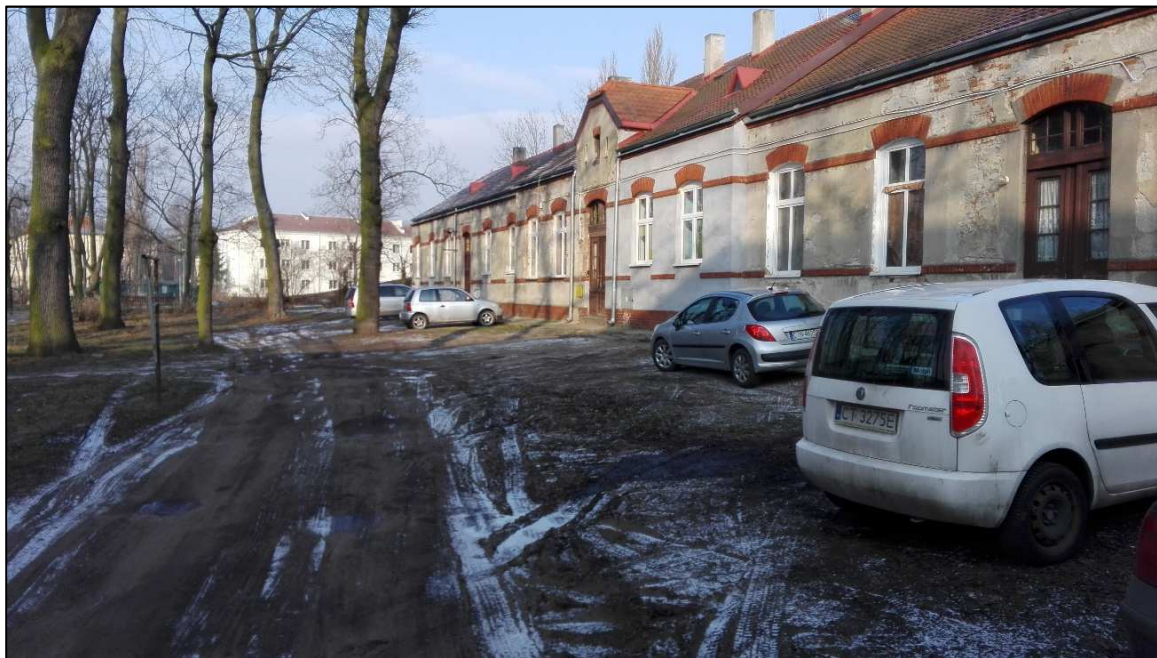
Fot. 1. Obszar przy ul. Narutowicza

Teren przy ul. Narutowicza zlokalizowany jest w obszarze zabudowanym, pośród domów wielorodzinnych (fot.1), kościoła rzymskokatolickiego, budynków Straży Miejskiej, Archiwum Państwowego, Skweru Prymasa Wyszyńskiego oraz osiedlowych sklepów.