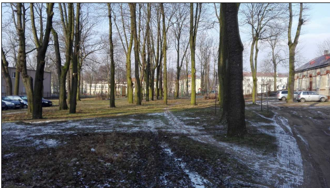
Fot. 2. Obszar przy ul. Narutowicza